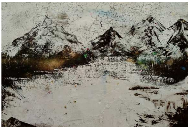
peinture sur pvc, 260x130, année 2016

«vien dietro a me, e lascia dir le genti: sta come torre ferma, che non crolla già mai la cima per soffiar di venti»